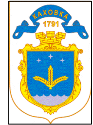
СХЕМА ТЕРИТОРІАЛЬНОГО РОЗВИТКУ М. КАХОВКА ХЕРСОНСЬКОЇ ОБЛАСТІ