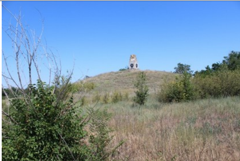
Дубовий гай. Вид з місця розташування будівлі музею на пагорб, де знаходився спостережний пункт