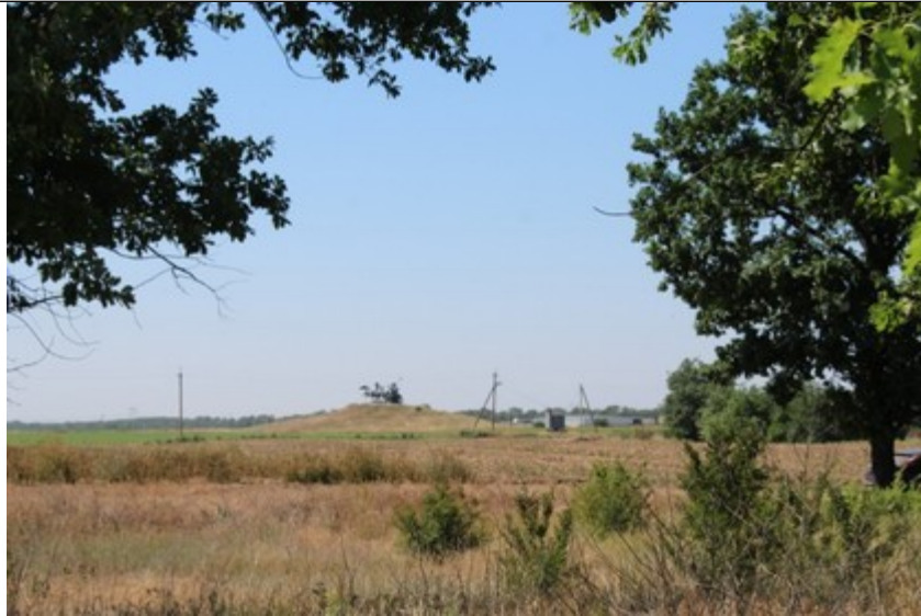
Дубовий гай. Вид з місця розташування будівлі музею на монумент «Легендарна тачанка»

Побудована у формі півкола (ніби обіймає підніжжя кургану спостережного пункту). Має чотири входи. Всередині розміщується інноваційна експозиція з урахуванням попередньо викладеної концепції. На внутрішньому майданчику можна розташувати: - мистецькі об'єкти або муляжі видів озброєння, які використовувалися на плацдармі; - зробити постійно діючу інсталяцію, фотозону для відвідувачів. Самі стіни музею використовуються як екран для проектування голографічних зображень або для перегляду тематичних фільмів чи презентації на наукових конференціях.